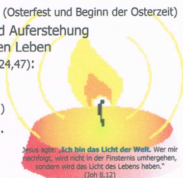
Jesus sagte: Ich bin das Licht der Welt . Wer mir nachfolgt, wird nicht in der Finsternis umhergehen, sondern wird das Licht des Lebens haben.“ (Joh 8,12)

Zum Karfreitag am 29.03.2013 sagte Papst Franziskus sinngemäß: Das Kreuz ist die Antwort auf das Böse . Die Christen müssten auf das Böse mit dem Guten antworten.